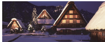
岐阜県白川郷の合掌造り集落

(4) 豪雪地帯で見られる、勾配の急な屋根を特徴とする住居は、雪をすべり落とし、雪の重みで家がつぶれないようにするための工夫である。