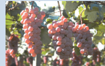
1 山梨県の勝沼にあるぶどう園

という俳句が有名であり、江戸時代にはぶどうの生産がさかんになっていたと考えられている。