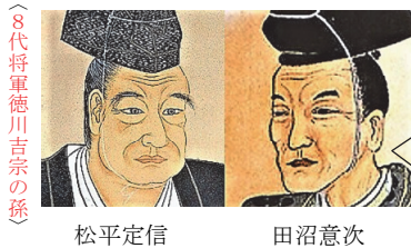
8代将軍徳川吉宗の孫

1 (1) 松平定信は、田沼意次の後に老中になった。質素・儉約を掲 重要 げて農村の立て直しと政治の引き締めを目指した寛政の改革と、商工業の発展に着目して経済政策を採用した田沼意次の政治は比較されやすい(コラム)。